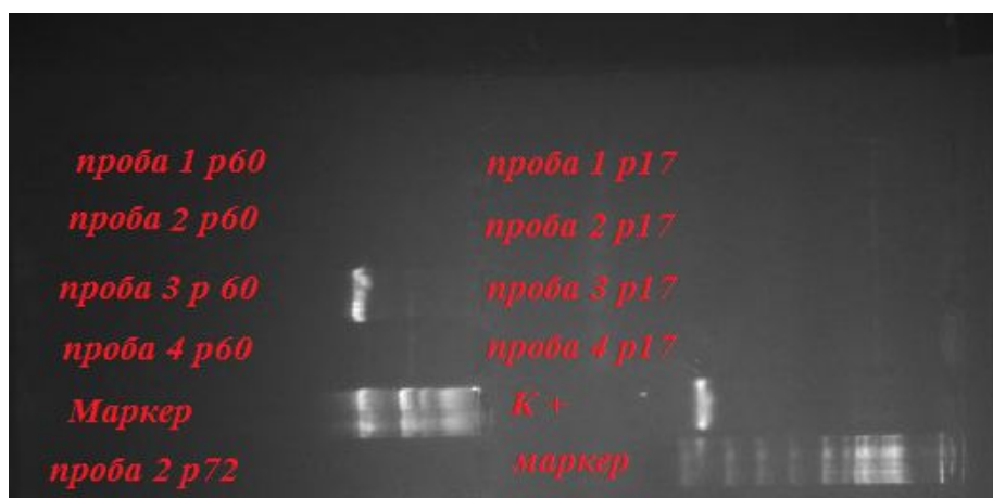
Рис. 2. Электрофорез плазмид в 1,5% геле

После для плазмид поставили электрофорез в 1,5% геле для определения размеров продуктов реакции и обнаружению комплекса в реакции.