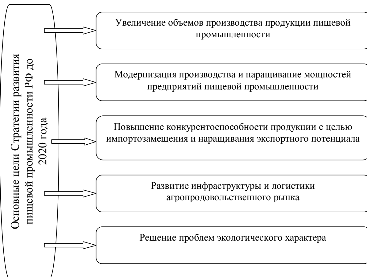
Рисунок 2 – Основные цели Стратегии развития пищевой промышленности РФ на период до 2020 года

Основные цели Стратегии развития пищевой промышленности РФ на период до 2020 года представлены на рисунке 2.